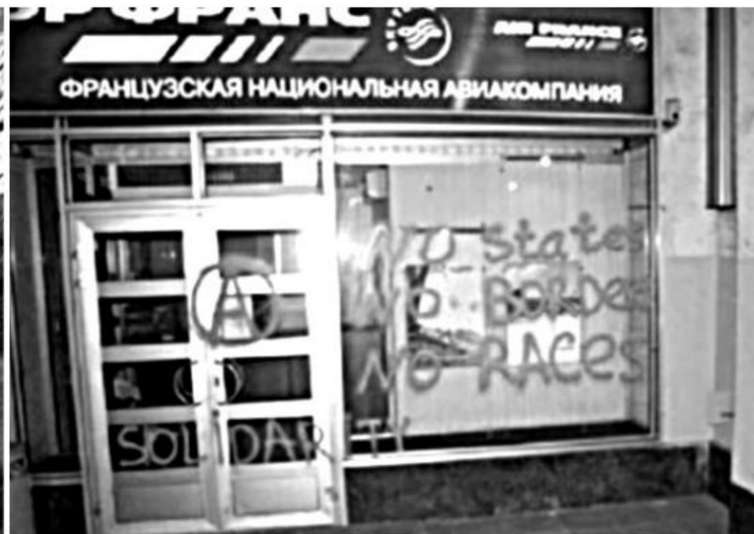
MOSCOU, 13 JUIN

Dans le XX e , rue des Pyrénées, c'est une agence Bouygues Telecom (l'entreprise Bouygues étant l'un des principaux constructeurs de prisons et de centres de rétention) qui a eu ses vitrines endommagées et taguées « FEU AUX PRISONS ». Rappelons que l'agence Air France du Faubourg-Poissonnière avait déjà été attaquée de manière similaire il y a deux mois. Continuons à harceler les entreprises qui font leur fric en construisant des prisons ou en expulsant des sans-papiers !