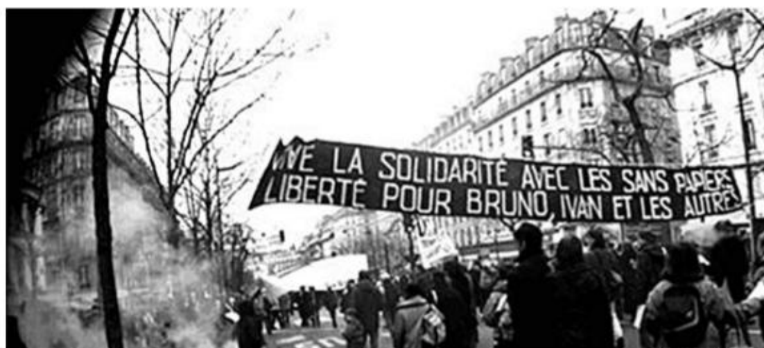
PARIS, 5 AVRIL