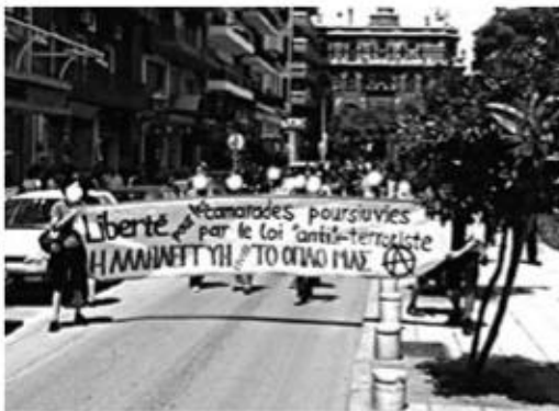
THESSALONIQUE, 13 JUIN