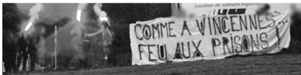
FRESNES, 2 JUILLET

Sète, 14 h, un cortège commence à se constituer. Une demi-heure plus tard, il s'ébranle et parcourt les rues du centre-ville. Il se dirige alors vers le centre de rétention au son de slogans comme « Pierre par pierre, mur par mur, détruisons les centres de rétentions (ou toutes les prisons) », « Ni prisons, ni frontières, ni centres de rétentions » ou « des papiers pour tous (ou pour personne !) ». Passant par le quartier alloué aux immigrés, des rencontres se font. Petit à petit le cortège grandit. C'est environ 150 personnes qui se retrouvent devant le centre de rétention de Sète. Là, un vacarme de ¾ d'heure vient saluer les sans-papiers enfermés (au nombre de 5 à ce moment, cantonnés dans une pièce d'où il leur est impossible de communiquer avec l'extérieur). Les slogans répondent aux pétards et fusées. Le portail est repris aux flics et sera tambouriné pendant un long moment... sans céder ! Le cortège repart alors en direction du port, laissant derrière lui quelques traces de son passage (tags, collages...). Un bateau de la compagnie COMANAV est à quai. Celle-là même qui régulièrement collabore avec l'État pour les expulsions. Les vigiles s'empressent de fermer la plateforme d'accès. Des tracts sont alors distribués aux personnes embarquant. Le cortège repart ensuite vers le centre-ville, avant de se disperser.