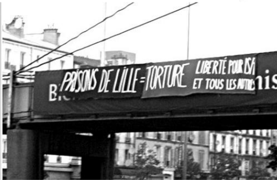
PARIS, 9 JUIN