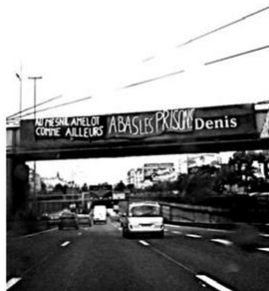
PARIS, 2 SEPTEMBRE

À 9 h, des prisonniers et prisonnières de Rouen ont pu voir une banderole « FEU AUX PRISONS » flotter dans les airs et voir et entendre peu après des pétards et des feux d'artifice.