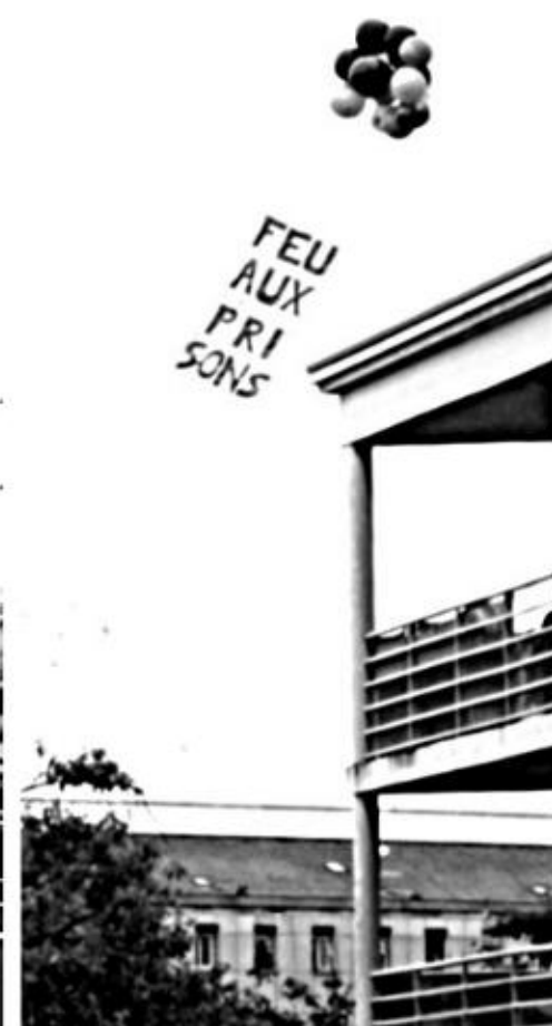
ROUEN, 2 SEPTEMBRE