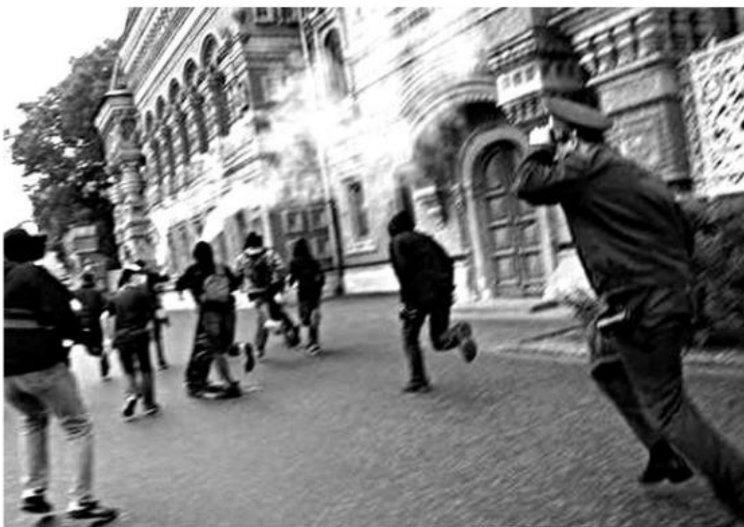
MOSCOU, 11 JUIN

« Dans la nuit du jeudi 12 au vendredi 13 juin, deux entreprises collaborant avec l'État ont été attaquées à Paris. Dans le IX e arrondissement, rue du Faubourg-Poissonnière, une agence Air France a eu toutes ses vitrines brisées et un slogan a été tagué dessus : « SABOTONS LA MACHINE À EXPULSER ». Air France prend en charge volontairement l'expulsion de la plupart des sans-papiers arrêtés.