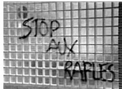
BRUXELLES, 13 JUIN