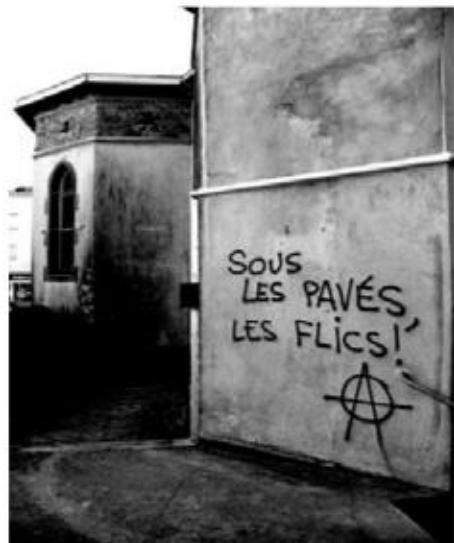
BREST, 9 JUIN

Rassemblement à 13 h 30 devant la préfecture puis occupation pendant quelques heures du musée de la Résistance par une cinquantaine de personnes. Des banderoles « Solidarité avec les sans-papiers », « Résistons encore ! » ou « Ni prison, ni frontières, ni matons, ni charters » ont été déployées sur sa façade, et de nombreux tracts distribués.