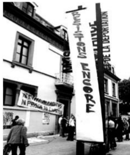
GRENOBLE, 11 JUIN