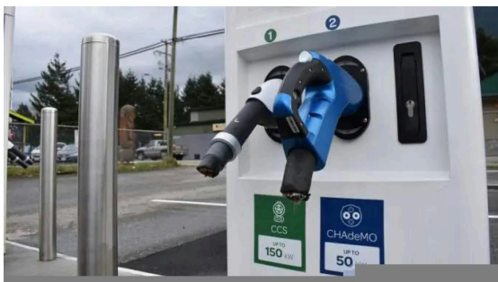
Station de recharge de véhicules électriques dont les câbles ont été sectionnés.

Plus il y a de voitures Tesla sur les routes, plus le réseau de surveillance de l'État s'étend ; la prétendue ligne de démarcation entre « citoyen » et « flic » s'efface. La technologie de surveillance mise au point par Tesla est reprise par d'autres constructeurs automobiles et fabricants de pièces détachées. Une nouvelle fonction de BMW permet aux utilisateurs de générer un rendu 3D en direct des abords de leur voiture grâce à une application pour smartphone. D'autres entreprises ne sont pas en reste et annoncent des fonctions similaires au « mode sentinelle » de Tesla.