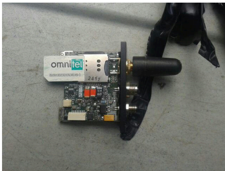
Un dispositif avec carte SIM trouvé dans un véhicule en Italie, en août 2019 5 .