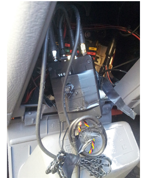
Des micros et une balise GPS trouvés dans la boîte à fusibles d'une voiture à Lecce, Italie, en décembre 2017 2 .