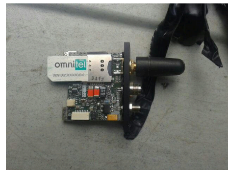
Un dispositif avec carte SIM trouvé dans un véhicule en Italie, en août 2019 5 .