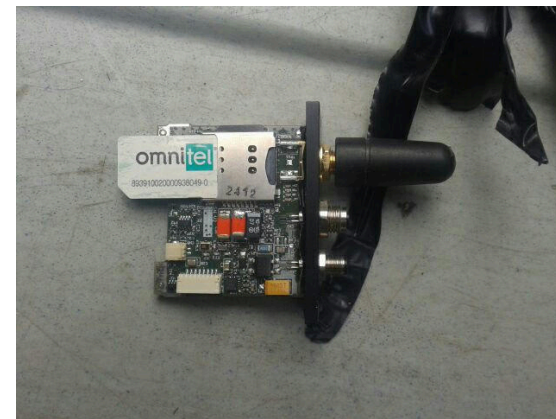
Un dispositif avec carte SIM trouvé dans un véhicule en Italie, en août 2019 5 .