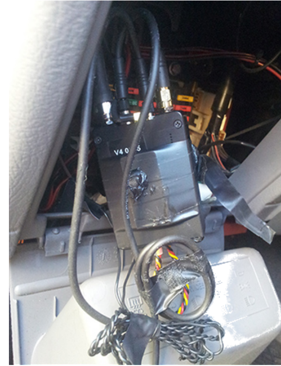
Des micros et une balise GPS trouvés dans la boîte à fusibles d'une voiture à Lecce, Italie, en décembre 2017 2 .