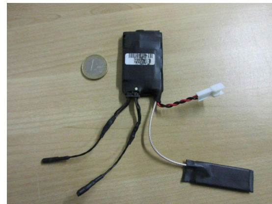
Micros trouvés dans une prise électrique dans un bâtiment à Bologne, Italie, en janvier 2018 1 .