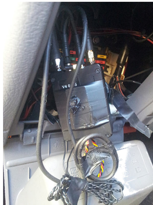
Des micros et une balise GPS trouvés dans la boîte à fusibles d'une voiture à Lecce, Italie, en décembre 2017 2 .