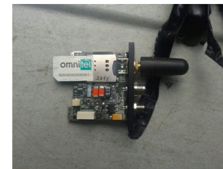
Un dispositif avec carte SIM trouvé dans un véhicule en Italie, en août 2019 5 .