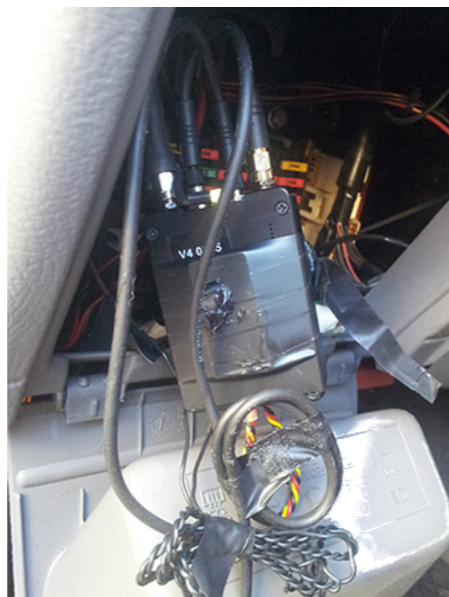
Des micros et une balise GPS trouvés dans la boîte à fusibles d'une voiture à Lecce, Italie, en décembre 2017 2 .